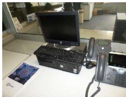
477. N. 1 Telefono da ufficio;