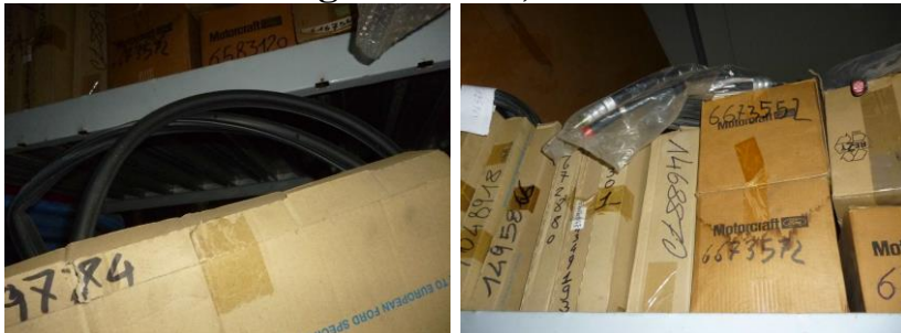
1218. N. 1 griglie Jaguar forse usata;