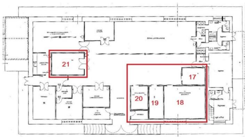
Planimetria dei lavori assentiti con C.E. n. 01/2005 del 07/04/2005

Si evidenzia che nella planimetria dell'immobile de quo, allegata alla citata Concessione Edilizia del 2005, sono rappresentate, come parti strutturali (tramezzi) dell'immobile, le " celle frigorifere " elencate nel citato inventario dei beni mobili ai nn. 17, 18, 19, 20 e 21.