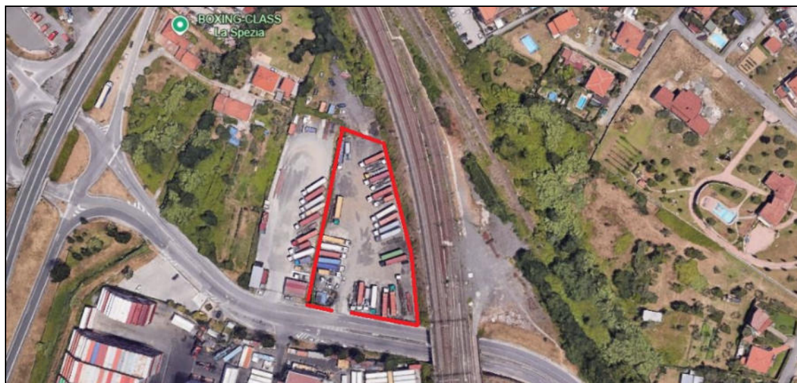
Vista dall'alto ravvicinata con evidenziato il lotto destinato a deposito

piazzale senza pavimentazione ma con semplice stesa di ghiaietto.