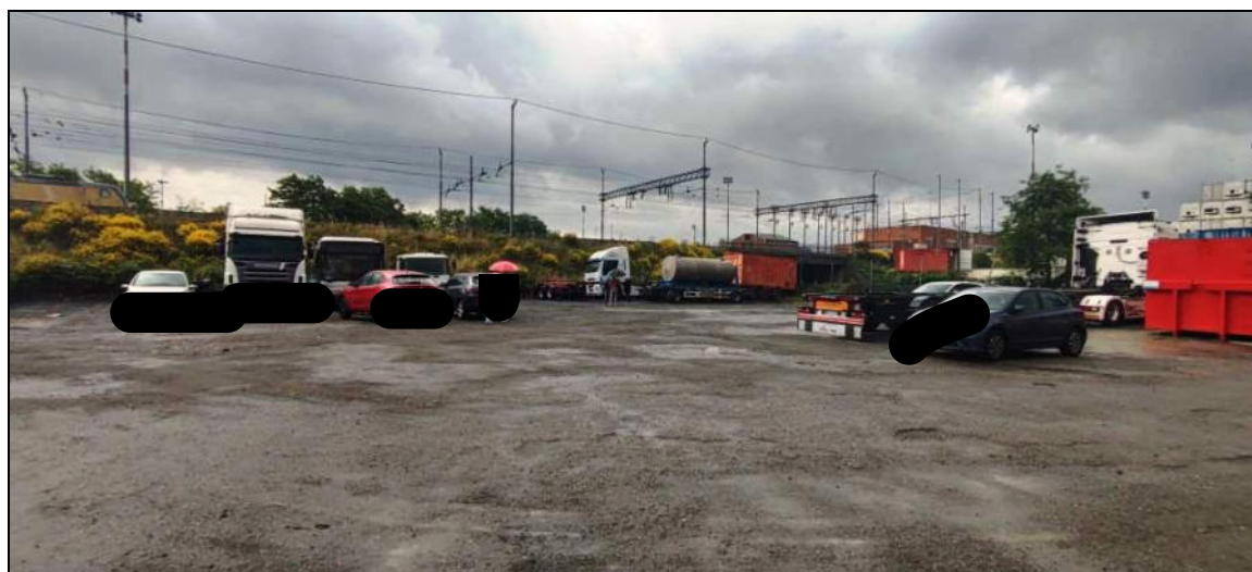
Foto del piazzale

Il Furgone, il camion motrice e i due rimorchi sono parcheggiati all'aperto a margine del terreno sul lato verso la ferrovia.