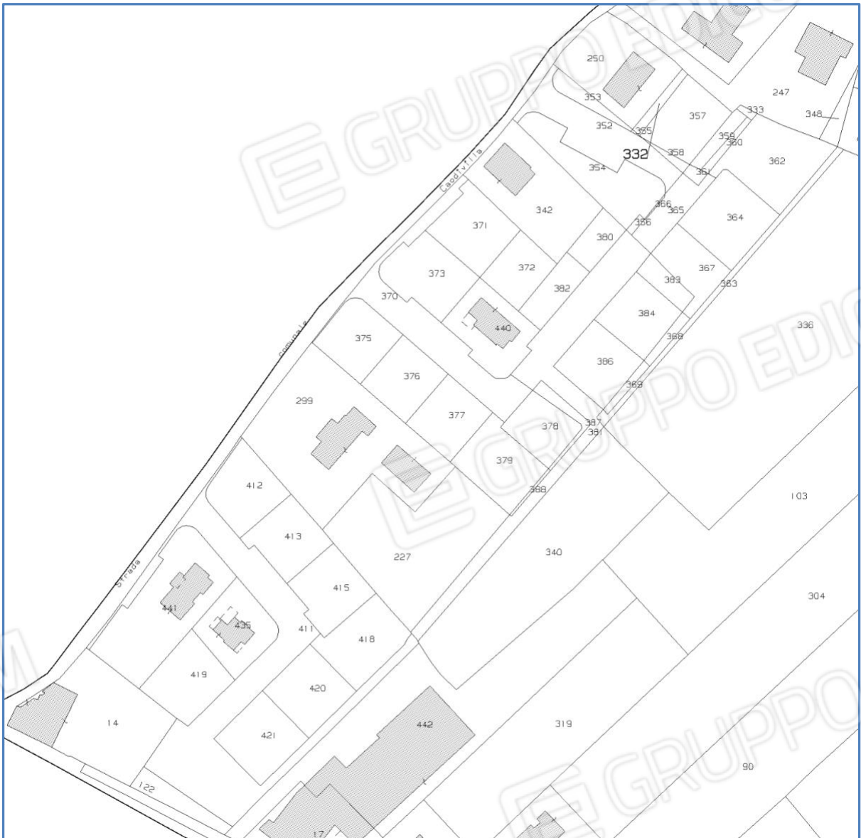
3. Estratto di mappa.