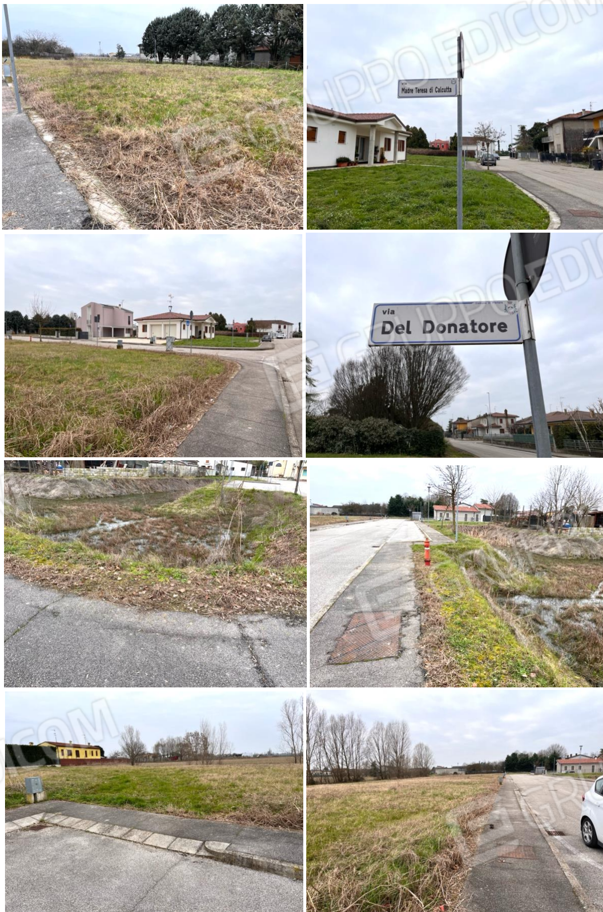
5. Riprese dell'area oggetto della lottizzazione San Rocco.