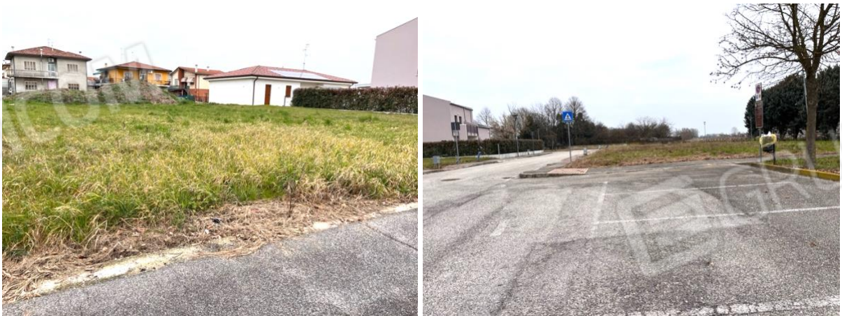
4. Riprese dell'area oggetto della lottizzazione San Rocco.