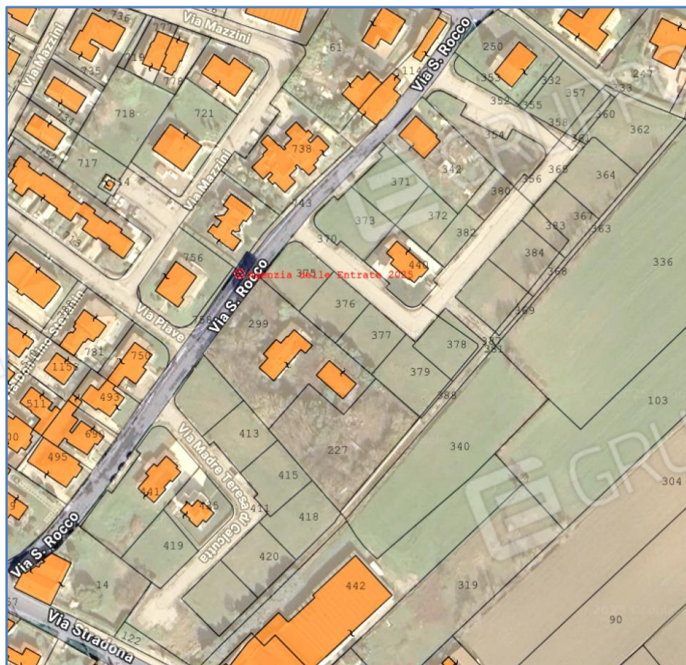
2. Vista sulla lottizzazione.