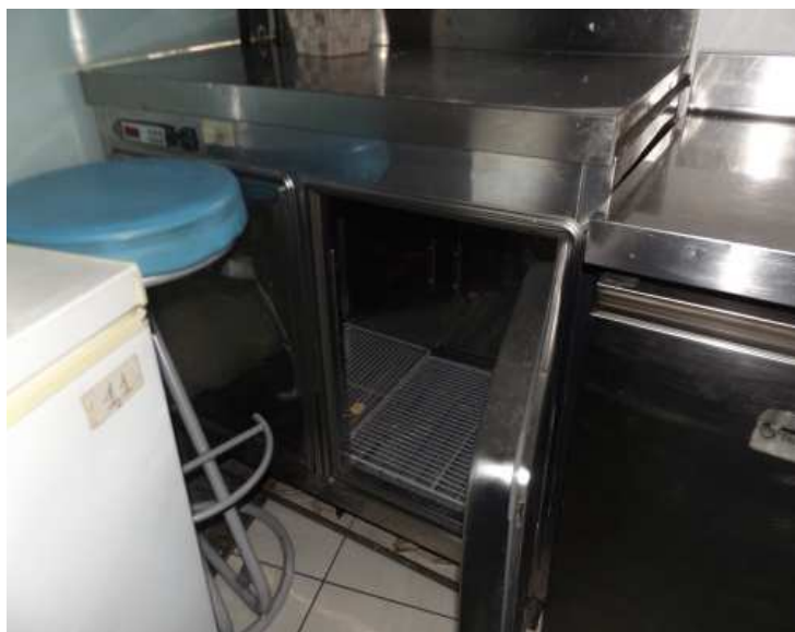
Banco da lavoro frigo 2 ante