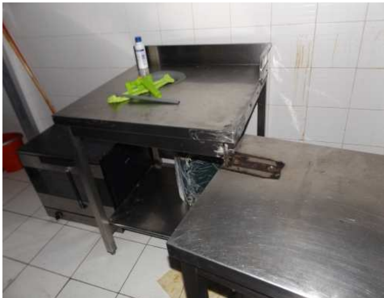
Banco da lavoro neutro di cernita e banco da lavoro neutro