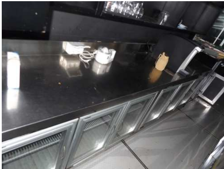
Retrobanco bar refrigerato