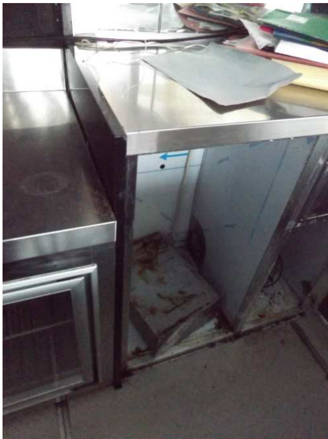
Banco bar macchina caffè