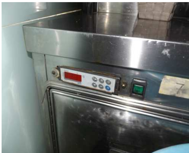
Display banco da lavoro frigo 2 ante