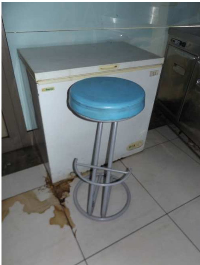
Congelatore a pozzetto