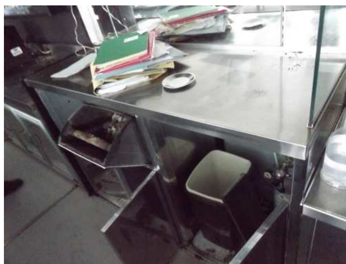
Banco bar macchina caffè