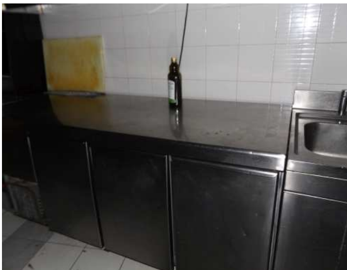
Banco da lavoro frigo 3 ante