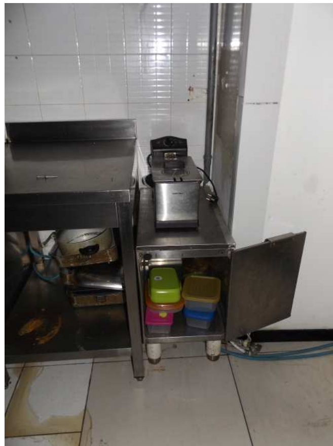
Banco da lavoro neutro e friggitrice