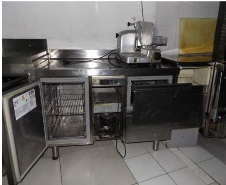
Banco da lavoro frigo 1 anta e due cassetti e macchina ghiaccio