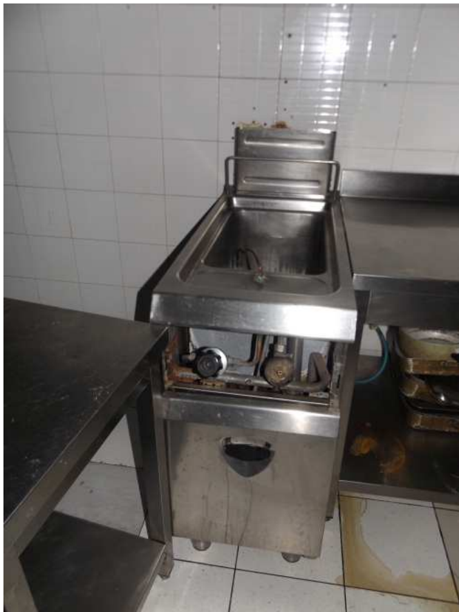
Bollitore ad una vasca a gas