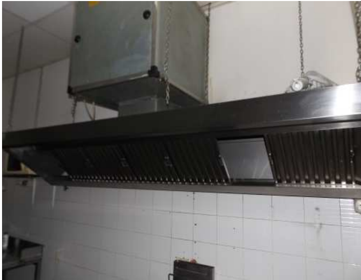
Cappa di aspirazione