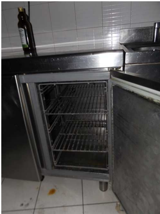
Banco da lavoro frigo 3 ante