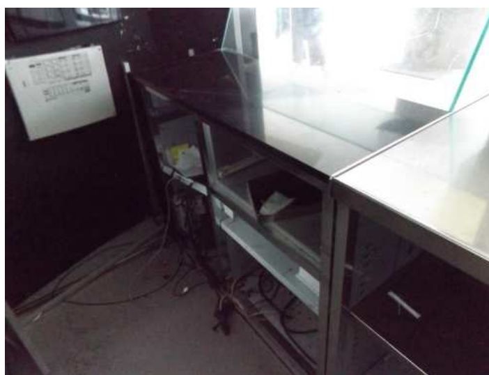
Bancone neutro cassa con vetro e bancone neutro